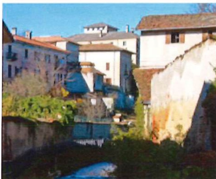
Ville de Suno

Programme détaillé disponible début 2025.